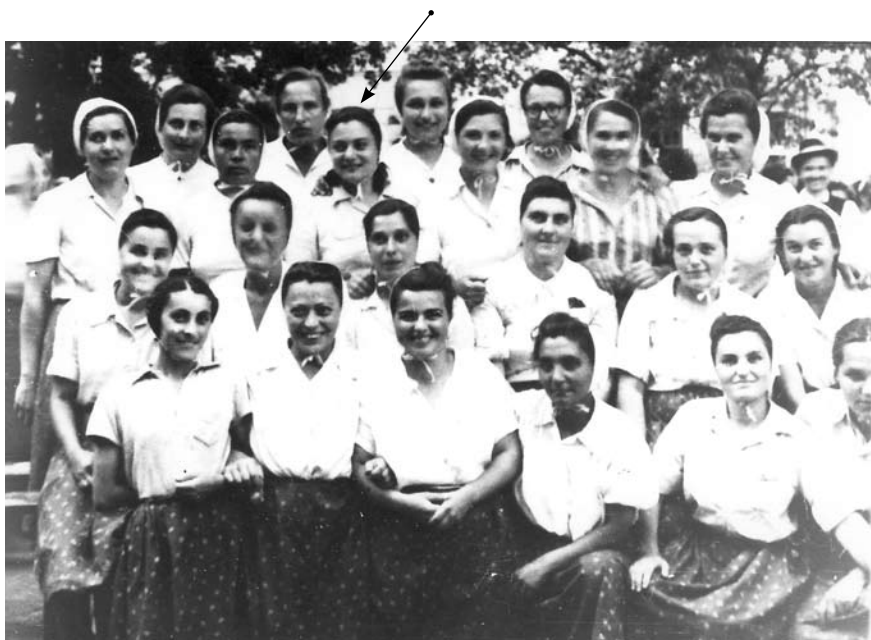
Slika 15 I krenule su kući vozom i pešice...