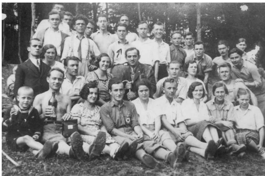
Slika 2 Pred izbijanje II svetskog rata, izletišta na Testeri (Fruška Gora) "Kamuflaža" za obuku napredne omladine