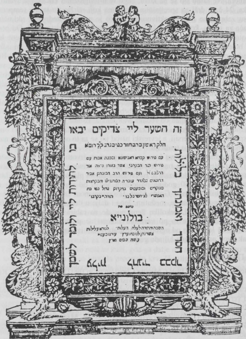
Naslovna strana Izreke otaca. Izdanje iz 1540. tiskano u Bologni.