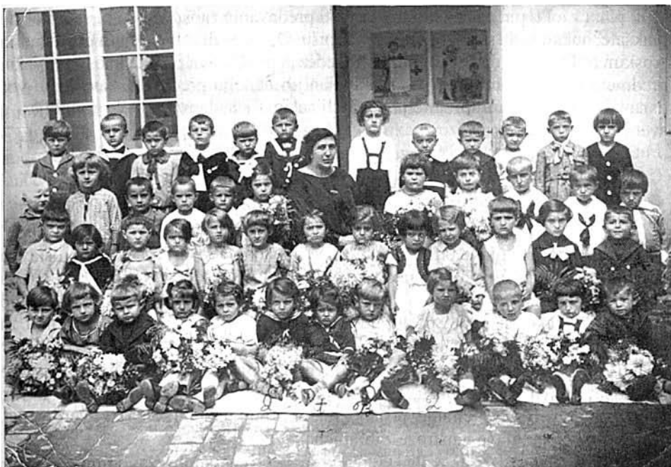
Nikolajevsko zabavište 1926. – fotografija iz albuma gospode Zore Mrnušćik.

Prvo "francusko" zabavište osnovano je 1928. u Novom Sadu, pet godina posle petrovaradinskog. U listu "Novi Sad" od 5. 07. 1930. na 2. strani objavljena je vest da je francusko dečije zabavište iz Petrovaradina te godine priredilo tradicionalnu " zabavu sa deklamacijama, pevanjem i igrankom". Važno je zabeležiti da je u Novom Sadu početkom 20. veka radila i škola za "mucavu decu" po metodu prof. Najmana iz Graca. Prema pisanju "Zastave" od 11. (24) juna 1914. škola u kojoj su se bavili "pogreškama u jeziku" kod dece trajala je 4 – 6 nedelja a radila je u ulici "Imre Tekelije 3".