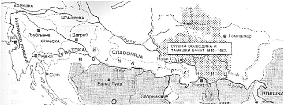
Južni deo Habzburške monarhije u kojoj se nalazio Novi Sad do kraja I svetskog rata