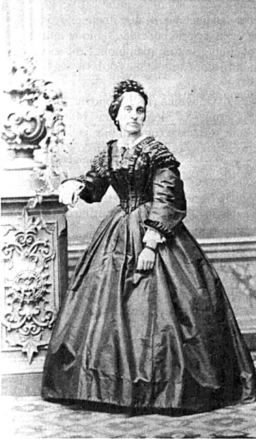
Gradanska, ženska nošnja iz druge polovine 19. veka – fotografija iz arhive Rukopisnog odeljenja Matice srpske (ROMS). Foto: B. Lučić.

Za istorijat borbe za emancipaciju žena na našem prostoru od izuzetnog je značaja što je gradsko područje bilo višenacionalno, te je za Srпкиnje, tokom 18. i 19. veka, načelo multikulturalnosti bilo od nacionalnog značaja.