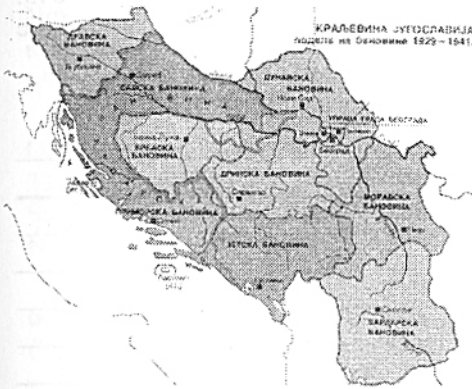
Novi Sad je u periodu 1918-1929 bio okvirima Kraljevine SHS a od 1929-1941. u okvirima Kraljevine Jugoslavije